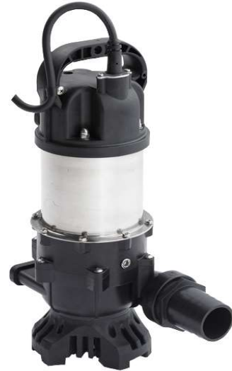
ตั้งได้นอนได้