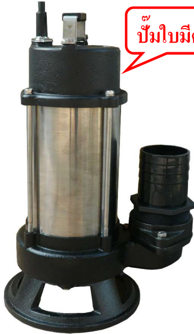
ปั๊มใบมีด

** DSK ปั๊มใบมีด (Cutter Pump) ซึ่งเล็บบใบมีดทำจากทังสเตน(Tungsten) บนกลีบใบพัดน้ำจะตัดเศษขยะที่ถูกสูบผ่านให้เป็นชิ้นเล็กลง โดยทำงานสัมพันธ์กับหน้างานที่ผลิตโดยผ่านชั้นการชุบแข็งเป็นพิเศษ