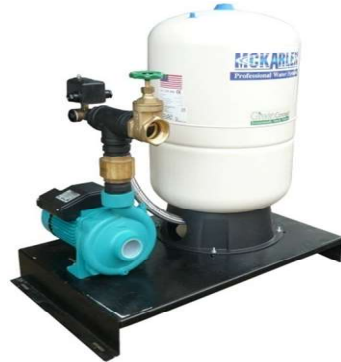
ZP-XXX-60, 100, 150