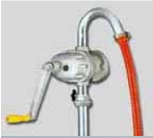
HP-1000B (รุ่นข้อโค้ง)