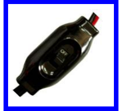
ขั้วหนีบและสวิตช์