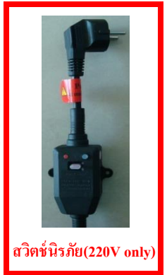
สวิทช์นิรภัย(220V only)