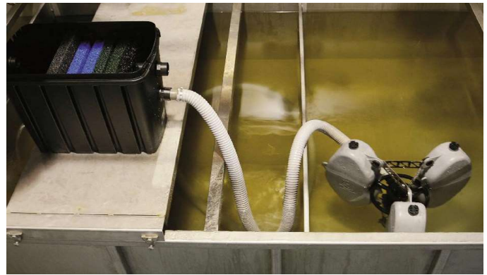
ใช้ดูดคราบน้ำมันเพื่อผ่านระบบบำบัดให้น้ำกลับมาใช้ใหม่