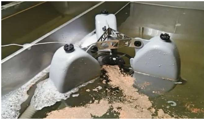
ใช้ดูดสิ่งเจือปนที่ลอยบนผิวน้ำ