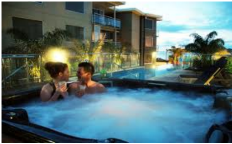
บ่อสปาขนาดใหญ่

สำหรับบ่อสปาขนาดใหญ่ ทำคลื่นเทียมในสวนน้ำ สระว่ายน้ำแบบอยู่กับที่ บ่อน้ำพุ น้ำตกจำลอง บ่อเลี้ยงสัตว์น้ำ