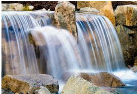
น้ำตกจำลอง