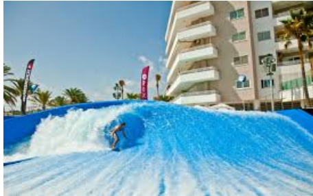
ทำคลื่นเทียม