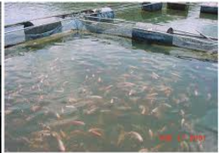
บ่อเลี้ยงสัตว์น้ำ