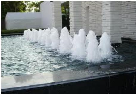
บ่อน้ำพุ