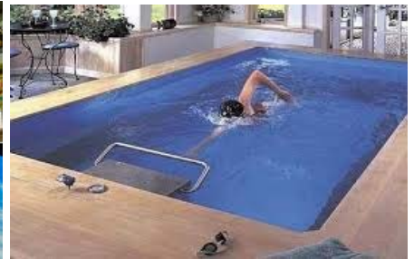
สระว่ายน้ำแบบอยู่กับที่